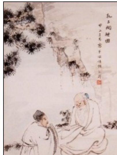
Confucio Preguntando a Lao Zi acerca de la Educación

Esta historia muestra la importancia que le damos a los Principios y Protocolos del Taekwon-Do. Esta guía describe algunos de los Protocolos necesarios en diferentes situaciones. Aunque no es una guía definitiva, este documento lo ayudará a entender mejor algunas de las maneras en las que utilizamos el Protocolo para demostrar respeto, disciplina, y compasión a todos.